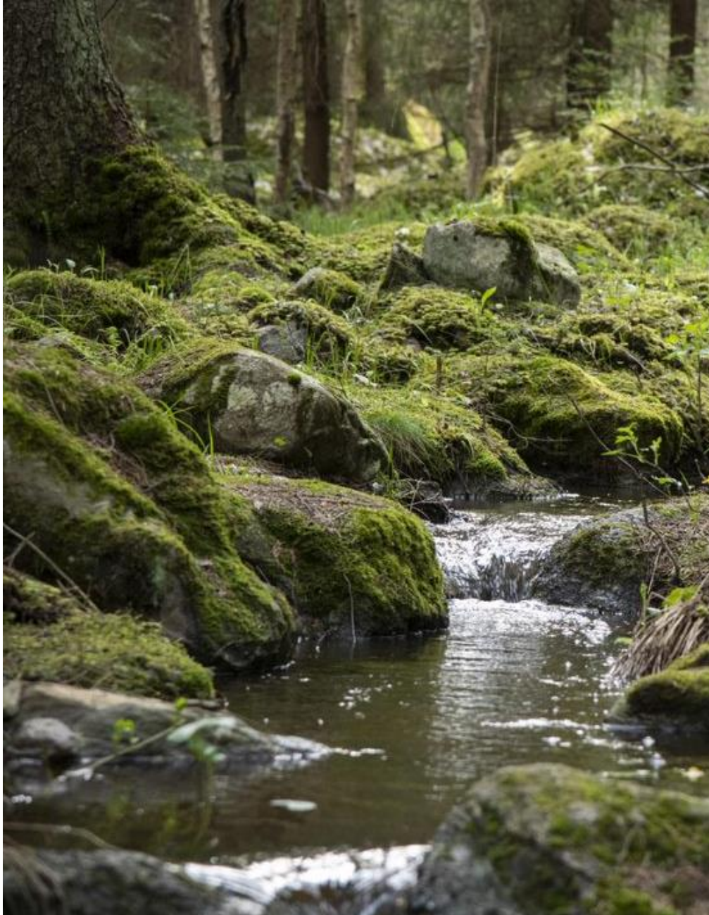
Valokuva metsäinen maisema, jossa puro.