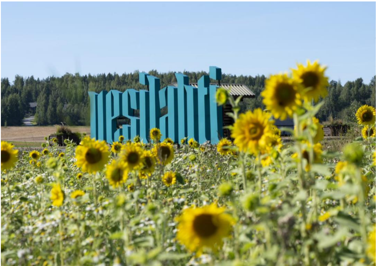
Valokuva maisemakuvassa Vesilahti -kyltti ja auringonkukkia.